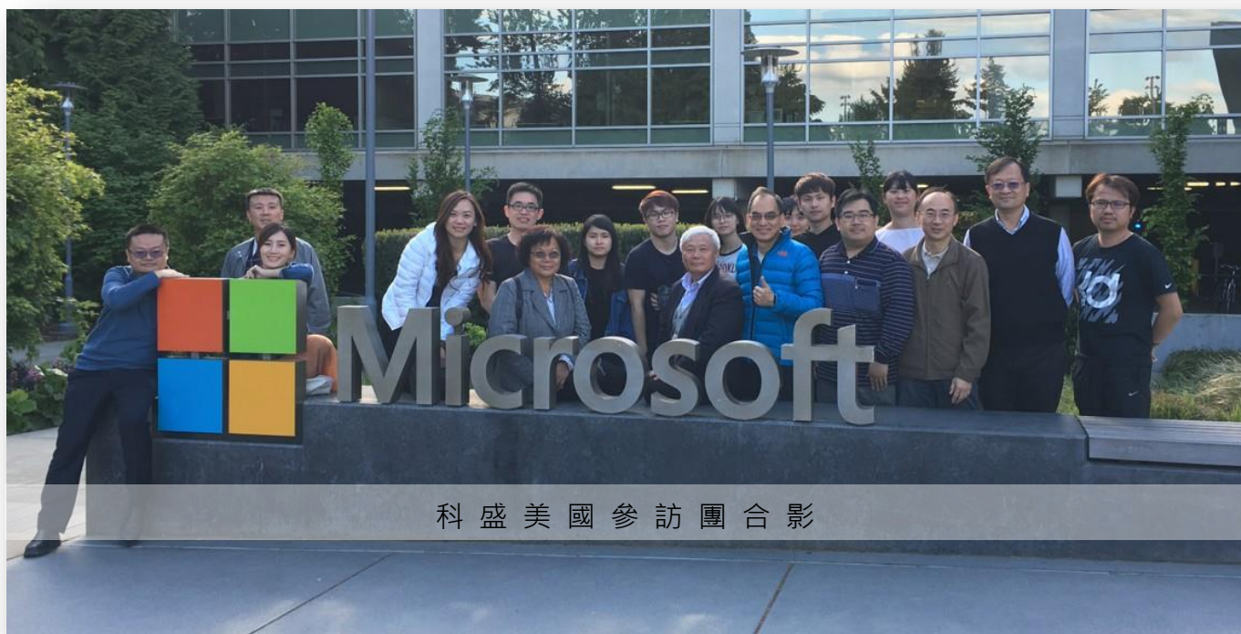
科盛美國參訪團合影